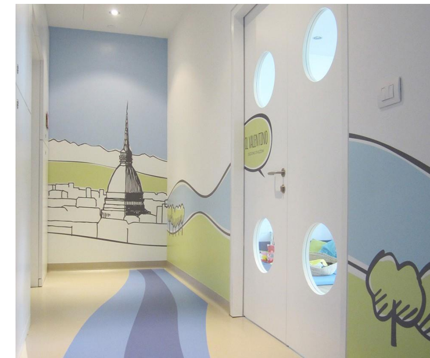
Intesa San Paolo